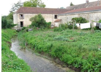
Ferme de Potençon à La Richarderie