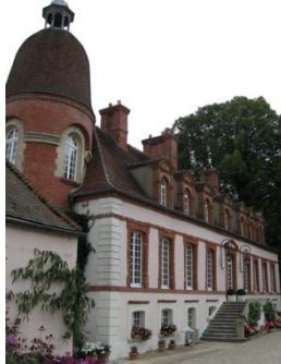
Domaine de La Tuilerie à Chennevières