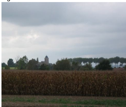
Eglise de Jouars