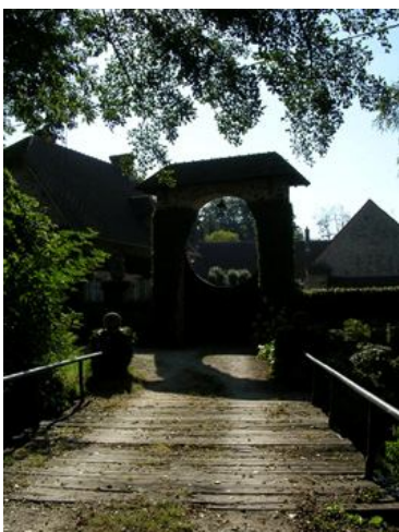
Moulin de Barre