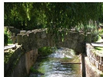
Pont sur le rû d'Elancourt à Chennevières