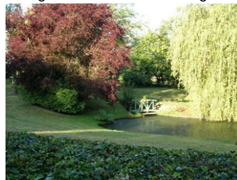
Etang du Moulin Neuf à Ergal