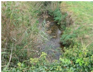
Rû de Maurepas